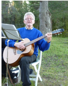
Sång på Täreändö holmen