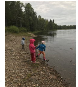
Ung som gammal

Dagarna avslutas med vandring tillbaka eller från Jupukka en vandring på leden ill Pajala och då kan vi njuta av naturen som vi har omkring oss och kröna denna härliga rekreativdag med ett leende på läpparna.