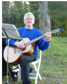
Sång på Täreändöholmen

tipsrunda med start från parkeringen på Täreändöholmen. Ansvarig: Hela styrelsen har ansvaret.